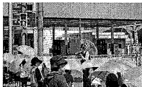
1・2年生 交通安全教室